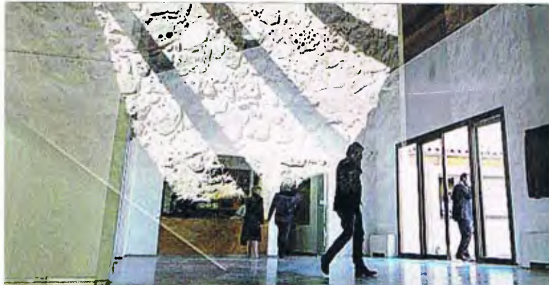
Centro e LEA Miguel Delibes

Villa del Libro es una nueva y atractiva apuesta de turismo cultural que la provincia de Valladolid ofrece a viajeros y bibliófilos de todo el mundo. La creación de este importantísimo recurso cultural se debe a la iniciativa de la Diputación Provincial que en el año 2007 fundó la primera Villa del Libro de España, en la villa medieval de Uruña.